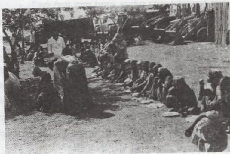
सेवाभावी संस्थांनी भूकंपग्रस्तांना घातलेला घास

किल्लारीवर भूकंपानंतर प्रेम करणाऱ्यांची संख्या दिवसेंदिवस वाढू लागली. आजूबाजूच्या गावात, शहरात असणाऱ्या भिकाऱ्यांना देखील किल्लारीला जाण्याचा मोह निर्माण झाला. तेथे शासन व सेवाभावी संस्था नित्य नव्या खाद्य पदार्थांची रेलचेल करीत असे.