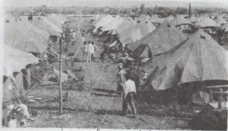
भूकंपग्रस्तांसाठी तात्पुरता बांधलेला तंबू

तंबू व टिनाचे शेड उभारून भूकंपग्रस्तांच्या निवाऱ्याची तात्पुरती व्यवस्था झाली होती. एका तंबूत तीन-चार कुटुंबे राहू लागली. जागा अपुरी. ज्याचे गाठोडे मोठे तंबूदी त्याला जागा. आपल्या जागेपुरते आपलं स्वतंत्र विश्व निर्माण करण्याचा प्रयत्न प्रत्येकजण करीत असे. पडद्यांच्या भिंती बांधून वंगवेगळी घरं एकाच तंबूत बांधली गेली. तंबू म्हणजे चार घराचे गाव होतं. सर्व जाती-धर्माचे लोक तिथे राहत होते. एखाद्या कुटुंबात खट्ट झाले की आवाज तंबूभर पसरत असे. कोणाला किती स्वास्थ्य लाभत असेल याची चर्चा न केलेली बरी. प्रत्येकाचे मानसिक संतुलन बिघडले होते. तंबूच्या आत आणि बाहेर सारखाच चिखल होता. प्रत्येकजण उध्वस्त झाला होता. यातूनच विकृतीने जन्म घेतला आणि अनेकजण दारूच्या गुत्याकडे वळले.