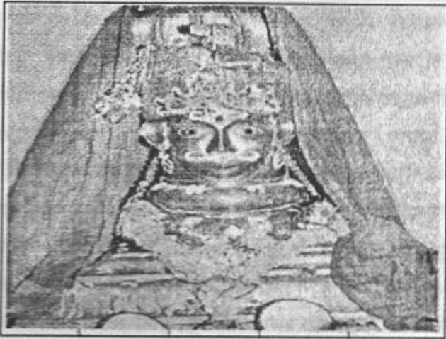
किल्लारीकरांचे ग्रामदैवत नीळकंठेश्वर

मांसाहार करीत नाही. यापेक्षा सामाजिक ऐक्याचे दुसरे आदर्श उदाहरण दिसत नाही. ही प्रथा अजूनही पाळली जाते हे विशेष होय. शुभकार्यांच्या सुरूवातीला नीळकंठेश्वराचे दर्शन घेण्याची प्रथा आहे.