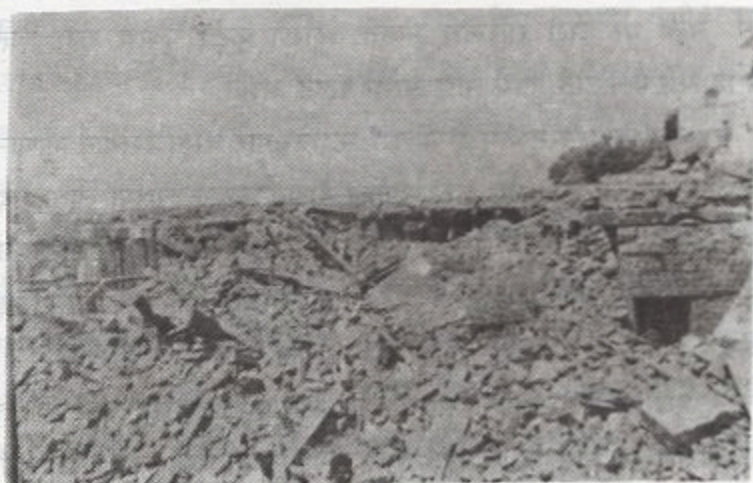
किल्लारी भूकंपाचा साक्षीदार / १३५

" अरे आता पुन्हा भूकंप होणार आहे... राहिले साहिले मरणार आहेत... कशाला ठेवता पैसा अडका... खा-पिया... मजा करा. "