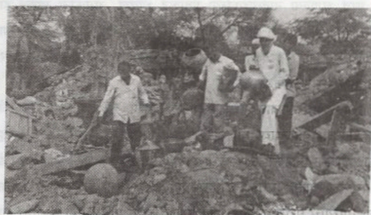
उध्वस्त घरातून शिल्लक राहिलेले सामान गोळा करतांनाचे एक चित्र

आयुष्यभर काबाडकष्ट करून मिळविलेली सर्व संपत्ती क्षणात जमीनदोस्त झाली होती. जे काही मिळेल ते सावडण्याचे काम काही जण जड अंतःकरणाने करीत हांते. जे जिवंत होते त्यांना पुन्हा नव्या जोमाने उभे राहायचे होते, जे झाले त्याला विसरून नव्या आयुष्याची सुरुवात आपल्याला करावीच लागणार. अशी जाणीव जिवंत असणाऱ्यांना होत होती. ज्या ढिगाऱ्याखालून प्रेते शोधून काढली तेच ढिगारे उपसतांना संसारउपयोगी वस्तू रडत रडत बाजूला काढून ठेवणारे अनेकजण ढिगाऱ्याढिगाऱ्यावर दिसत होते. या प्रसंगी बाहेर गावचा कोणी नातेवाईक आलाच तर गळा काढून रडत रडत आपले दुःख कमी करत असे.