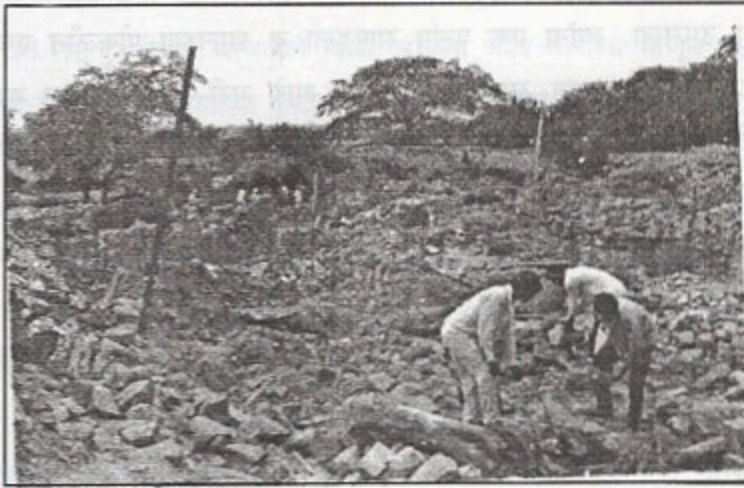
दगडामातीच्या खिंडान्यात प्रेतांचा शोध घेत असताना त्यांचे नातेवाईक

किंवा नाट जाळून त्यावर त्या कुजलेल्या देहाची हाडं ठेवली जात. हवेत साचलेली दुर्गंधी काही कमी झाली नाही. म्हणून कुठेतरी दबलेल्या प्रेतांचा शोध लावण्यासाठी मुंबईच्या एका सेवाभावी संस्थेने फ्रान्सचे पथक वॉर्नॉवेलं