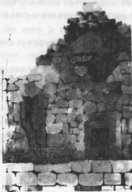
२१ किल्लारी भूकंपाचा साक्षीदार / २१