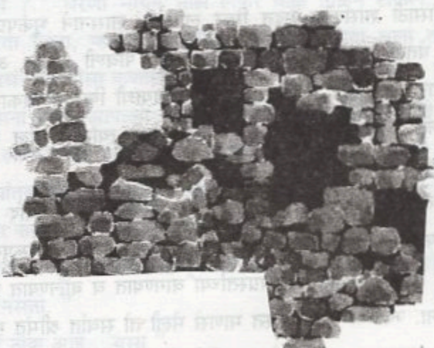
किल्लारी भूकंपाचा साक्षीदार / १४३

आणि राजवाड्यातील संसार सारखाच असतो. फक्त निवाऱ्यांचा आकार व वैभवात फरक असतो. भूकंपापूर्वी वाडा संस्कृतीत निवांत संसार करणाऱ्यांना भूकंपानंतर नियतीने शोडसंस्कृतीत आणून सोडले. नियतीच्या इशान्यावर नाचणाऱ्या माणसाने प्रसंगाप्रमाणे राहायचे ठरवून प्रत्येकजण दहा वाय साडे सत्तराच्या शोडमध्ये आपले विश्व सुरक्षित ठेवण्याचा प्रयत्न करू लागला. शेवटी कुटुंब आणि निवारा महत्त्वाचा असतो, हेच खरे.