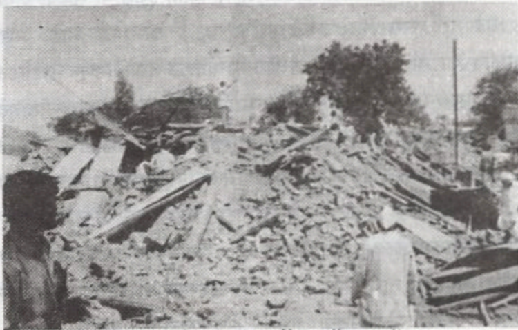
काहों क्षणातच बांचराख झालेल्या किल्लारी गावातील एक दृश्य