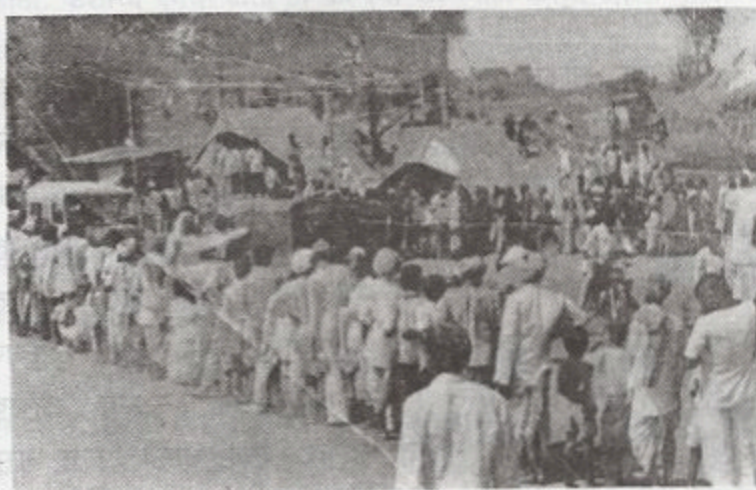
मदत साहित्य घेण्यासाठी रांगेत उभे राहिलेल्या भूकंपग्रस्तांचे एक चित्र

तंबूत किंवा शेडमध्ये राहणाऱ्यांचे पूर्वीचे मानसन्मान शून्य झाले होते. मदतीचे वाहन आल्यावर सगळेजण लाईनीत उभे राहत. 'सुंब जळालं तरी त्याचा पीळ काही उकलत नाही' या उक्तोप्रमाणे त्यापैकी काहीच्या मनातील पीळ कायम होता. अशा लोकांचे मन लाईनमध्ये जाण्यासाठी चटकन तयार होत नसे परंतु निसर्गाने कोणाचाच पीळ कायम ठेवला नाही. भूक सर्वांचीच सारखी असल्यामुळे प्रत्येकालाच भाकरीच्या मागे धावण्यावाचून गत्यंतर नव्हते.