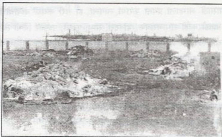
किल्लारी गावात सर्वत्र जळणाऱ्या प्रेतांची अशी दृश्य.

भूकंपात पडलेल्या घरांचे वासे, किलचन जे सापडेल ते गोळा करून दिसेल त्या मोकळ्या जागी त्या प्रेताचा अंत्यविधी पार पाडीत. गावात जिकडे पाहावे तिकडे प्रेते जळत होती. समृद्ध किल्लारीचं रूपांतर एका स्मशानभूमीत झाले होते. आकाशात धुरांचे ढग निर्माण होऊ लागले.