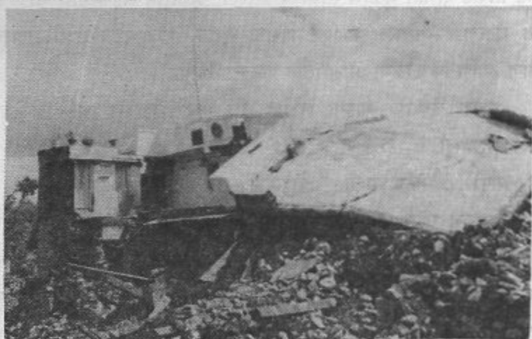
लेखक राहत असलेले निवासस्थान

आम्ही ज्या घरात राहत होतो, त्या घरातून बाहेर येता क्षणीच छत कोसळले. त्या वेळेस कोणताच विचार आला नाही. परंतु जेव्हा ह्या भयाण प्रसंगाची आठवण होते तेव्हा अंगावर शहारे येतात. एखाद्या सेकंदाने घराबाहेर पडण्यास जर विलंब झाला असता तर आम्हीसुद्धा इतरांसारखेच दिगाऱ्याखाली समाधीस्थ झालो असतो. हा प्रसंग आठवला की वाटतं बरं झालं त्या दिवशी आपण प्यालो नाही. तर मलाही जाग आली नसती व घराबाहेर पडता आले नसते. या विचाराने आजही मी भयभीत होतो. त्या रात्री झोपण्यापूर्वी भितीवरील गणरायाचे दर्शन झाले होते. कदाचित त्यानेच भूकंप हांता क्षणोच आम्हाला जागे केले व बाहेर पडण्याची बुद्धी दिली असावी. अशी माझी श्रद्धा आहे.