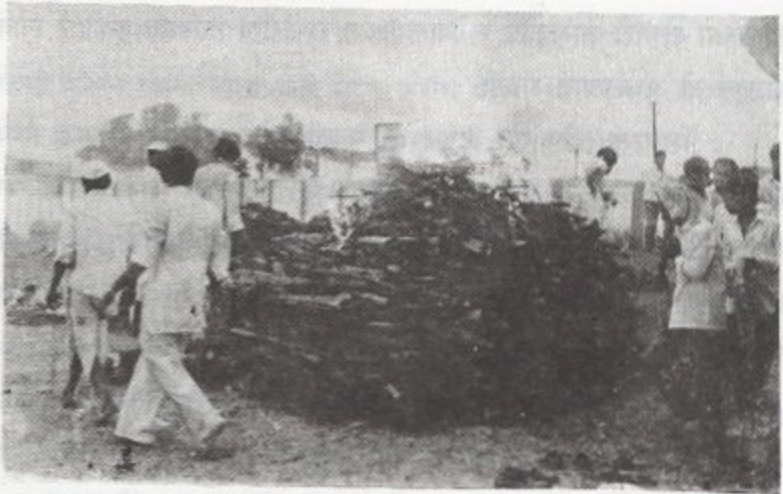
एकाच चीतेवर अनेक प्रेतांना अग्नि देत असताचे दृश्य

कोणी अर्धवट पुरलेल्या अवस्थेत दिसू लागला. सामूहिक सरणावर जळालेल्या प्रेतात कोणाचा हात शिल्लक राहिला तर कोणाचे डोके. पुन्हा काल सूर्यास्ताच्या वेळी सुरू झालेली प्रक्रिया दुसऱ्या दिवशी सूर्योदयाच्या वेळी पार पाडली.